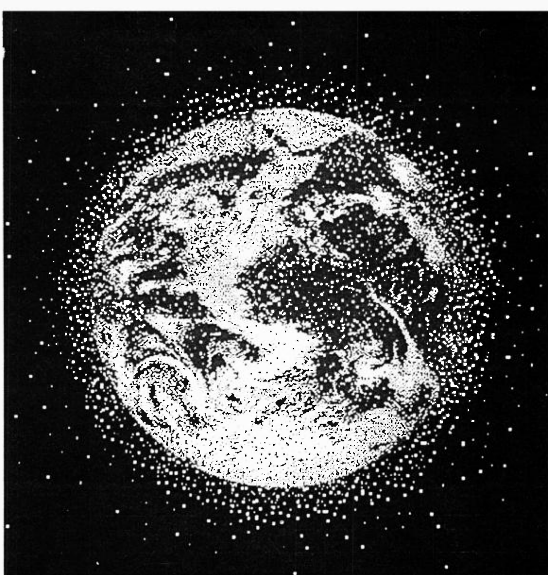
Il en tombe tous les jours ! Plus de 7 000 objets plus gros qu'une balle de ping-pong tournent autour de la Terre (points rouges) : satellites, coiffes de fusées et débris divers sont les principaux éléments de ce bric-à-brac céleste. Des morceaux parviennent parfois jusqu'au sol.