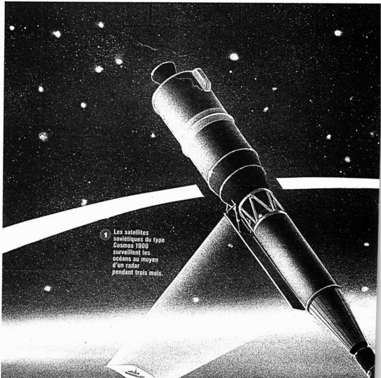
1 Les satellites soviétiques du type Cosmos 1900 surveillent les océans au moyen d'un radar pendant trois mois.

Ce satellite soviétique doté d'un générateur nucléaire tombe vers la Terre. Le risque qu'une partie des 50 kg d'uranium enrichi et des débris radioactifs atteignent des régions habitées reste cependant très faible.